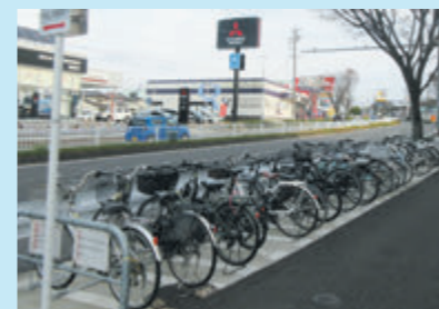
徳重第8自転車駐車場

徳重駅南東部（扇川の南東か所）に徳重第8自転車駐車場（37台分）及び徳重第9自転車駐車場（27台分）合計64台分を増設しました。