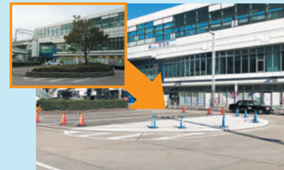
植樹帯撤去後の駅前ロータリー

鳴海駅前ロータリーではバスのすれ違いができず、早めのバス停待機ができないため、乗降待ちの方々が寒暖時期にも長時間待たなければならないので、対策してほしい。